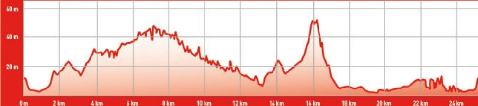
PISTE VTT N°10 • NO POUMÉI

Piste labellisée par la Fédération Française de Cyclisme (FFC)