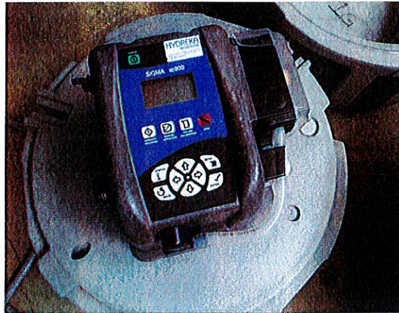
Tête de prélèvement pour programmation du bilan 24h

A la fin du prélèvement sur 24h, nous avons réalisé un échantillon moyen, que nous avons transmis au laboratoire agréé pour analyse.