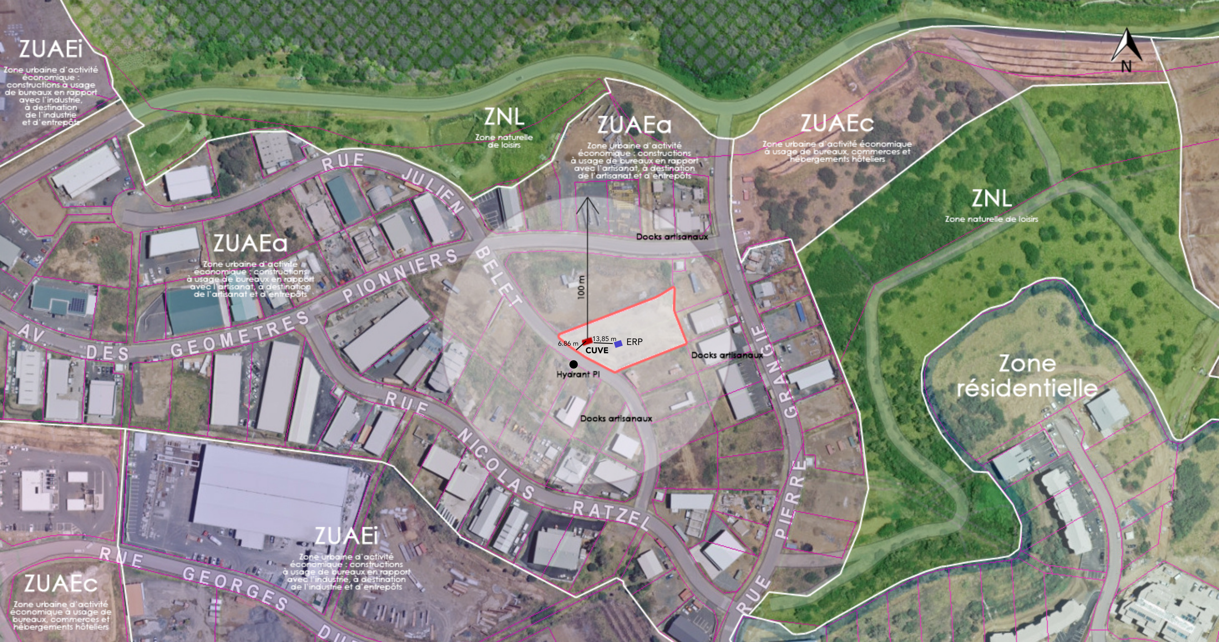
PROJET CASSEROLETTE - LOT 435 - ZAC PANDA : POSITIONNEMENT DES ÉTABLISSEMENTS RECEVANT DU PUBLIC - RAYON 100 M