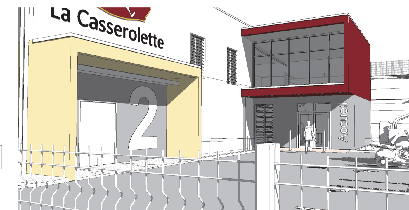
2 Vue 3D 5