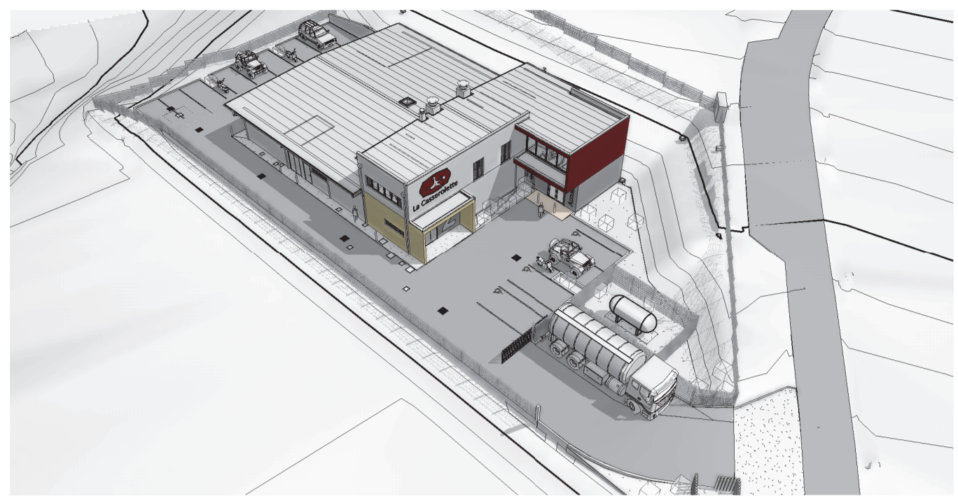
1 Vue 3D 4

Conçu par S. Beraha & C. Bruges Vérifié par A. Oesterlin Echelle (imprimé sur A1) 1 : 100 Date 07 Sept. 2020 Phase PCM A 02.