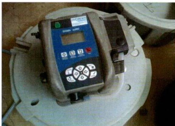
Tête de prélèvement pour programmation du bilan 24h

A la fin du prélèvement sur 24h, nous avons réalisé un échantillon moyen, que nous avons transmis au laboratoire agréé pour analyse.