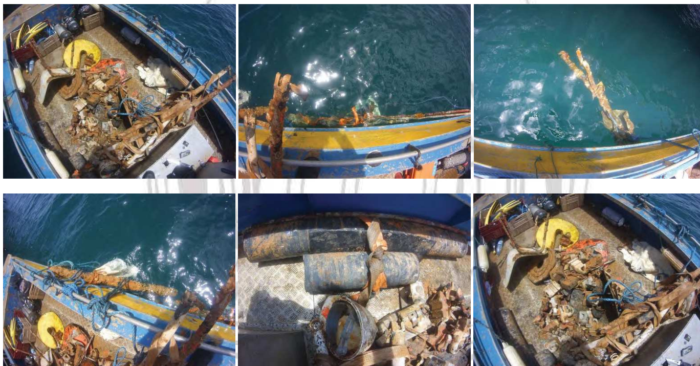
Dépose des objets déchets sur rampe de mise à l'eau