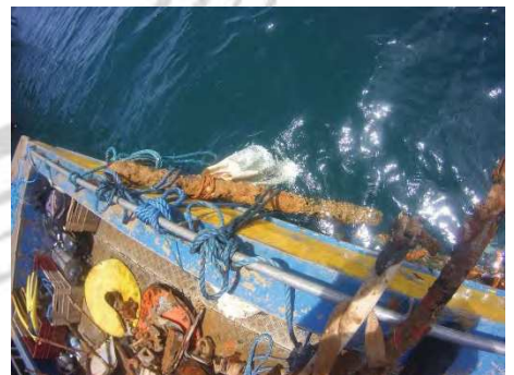
Chargement du navire de travail ETSM/PRODIVE