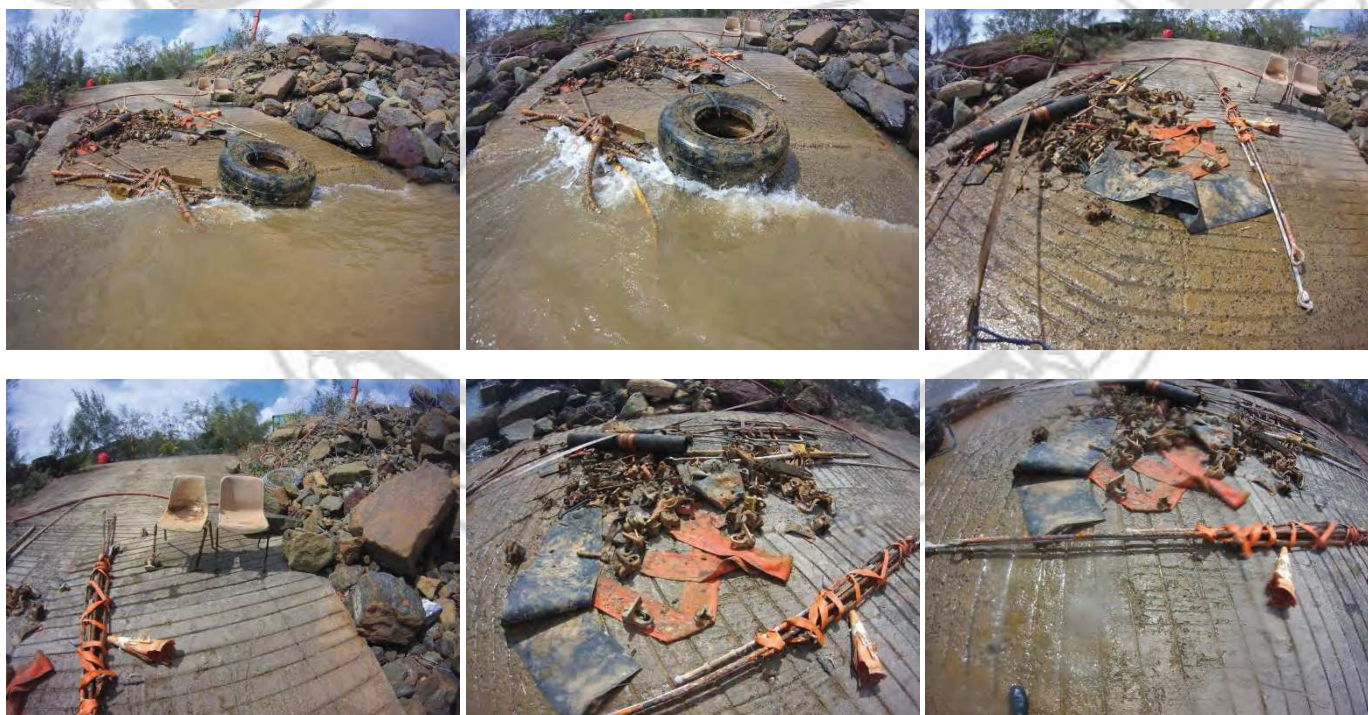
Fin des opérations de dépose et regroupement