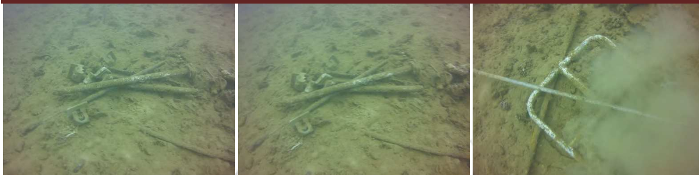
Chargement du navire de travail ETSM/PRODIVE