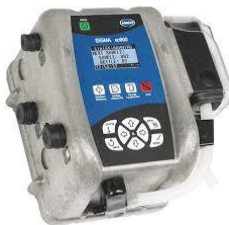
Tête de prélèvement avec écran de programmation