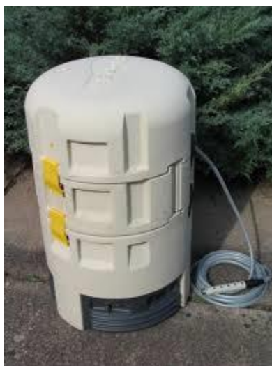
Préleveur réfrigéré avec crépine

Le bilan 24h est réalisé avec un préleveur automatique réfrigéré HYDREKA contenant 24 échantillons de 1L chacun. Après programmation du préleveur, l'eau du clarificateur est prélevée 8 fois par heure, par une crépine reliée au préleveur par un tuyau vinyle. Ce dernier est automatiquement purgé avant et après chaque prélèvement pour éviter toute contamination et assurer leur fiabilité. Le plateau amovible du préleveur permet la commutation des flacons d'échantillonnage toutes les heures.