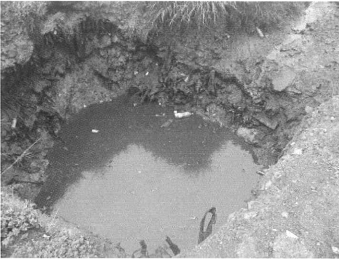
Photo 7 : Trou réalisé pour récupérer les eaux polluées provenant du traitement par géosacs