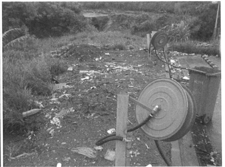
Photos 1 et 2 : Travaux réalisés sur la zone de lavage. Présence de nombreux déchets sur cette zone