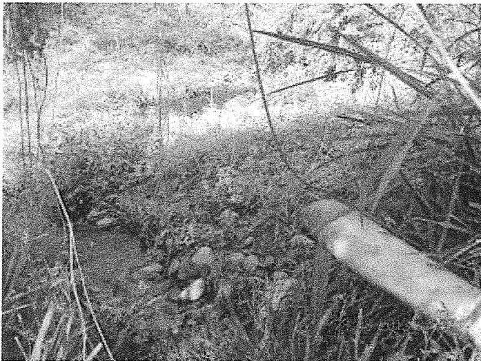
Point de rejet des eaux traitées en sortie de la 3 ème lagune