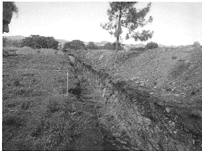
Tranchée d'enfouissement des déchets d'abattoir