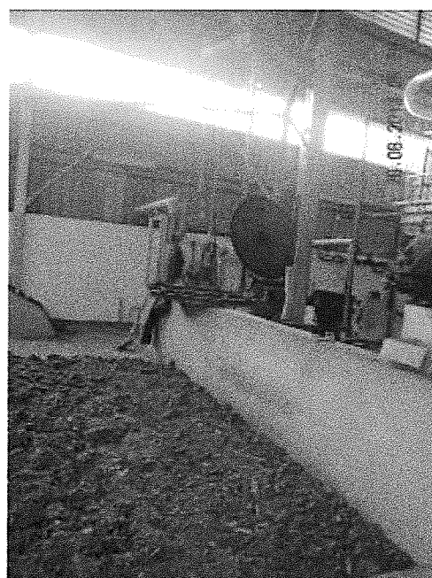
Unité de fabrication de farine animale