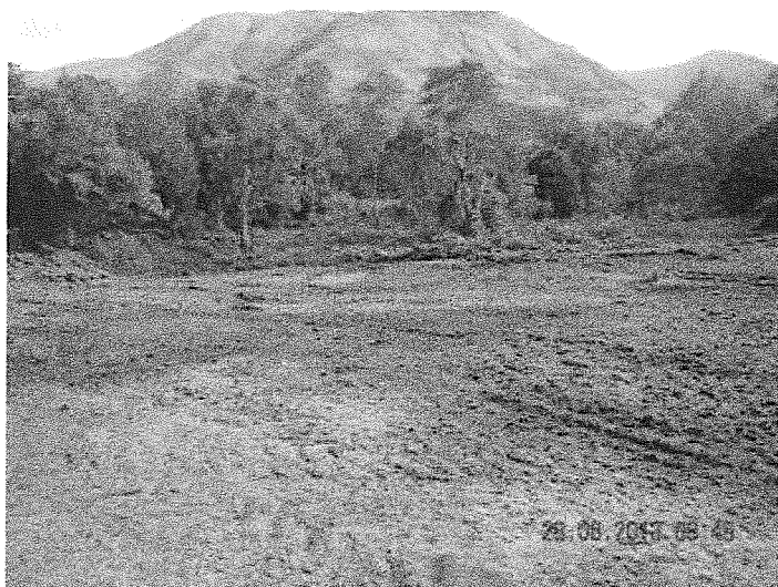
Zone d'épandage des rejets de dégrillage