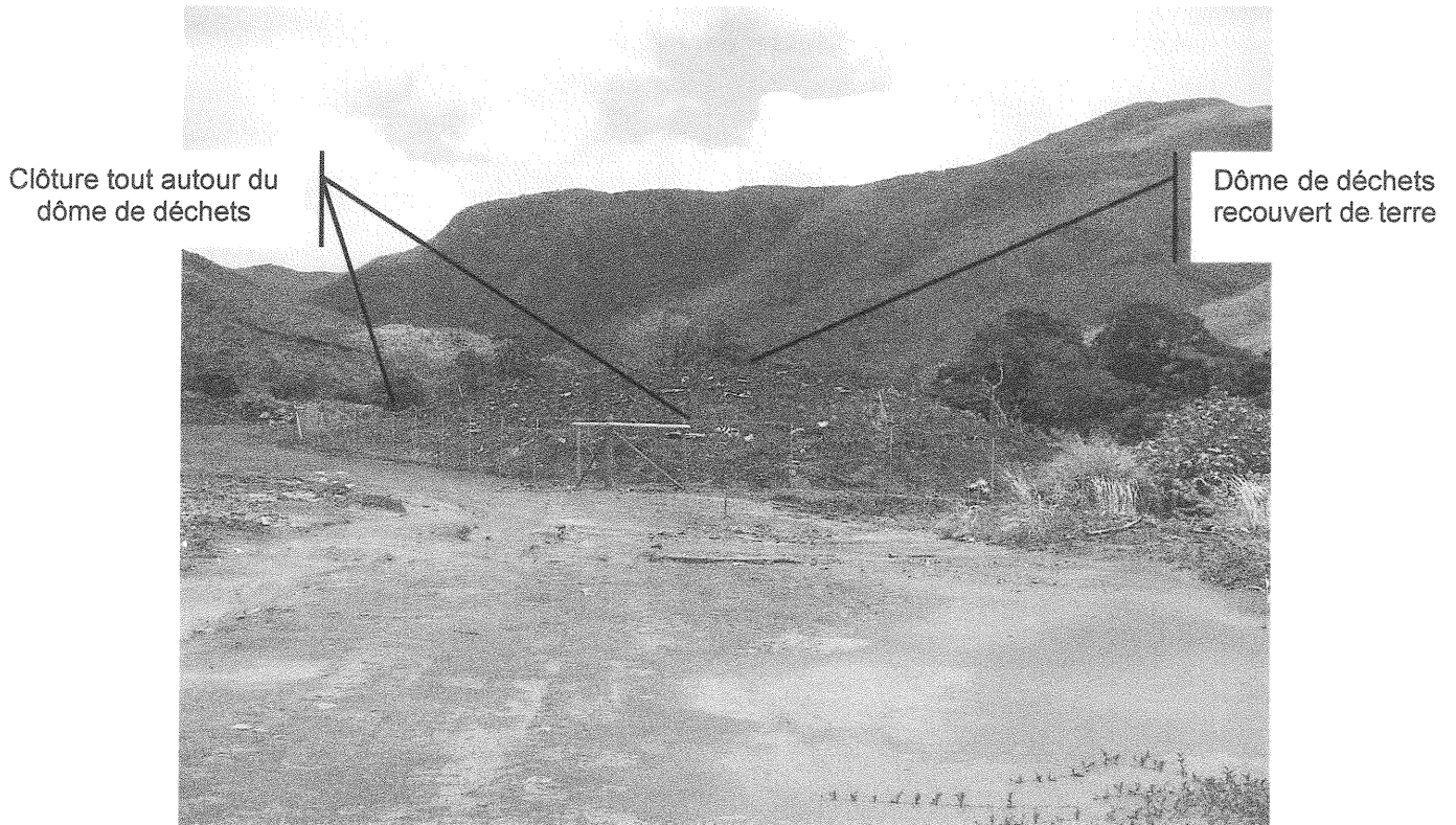
Figure 1: Dôme de déchets et clôture