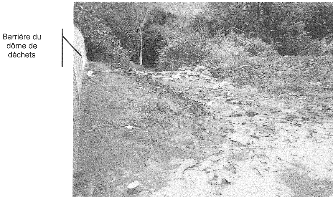
Figure 2: Drain sur le côté face à l'entrée du site