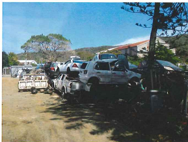
Photo n°2 : stockage situé sur la gauche au niveau de l'entrée de la casse réservée aux livraisons de voitures