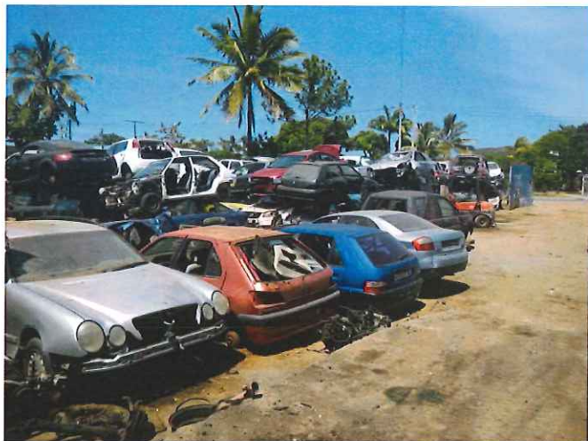
Photo n°1 : stockage situé sur la droite au niveau de l'entrée de la casse réservée aux livraisons de voitures