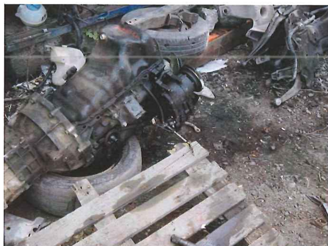
Photo n°5 : stockage de moteurs non réutilisables et présence d'hydrocarbures sur le sol