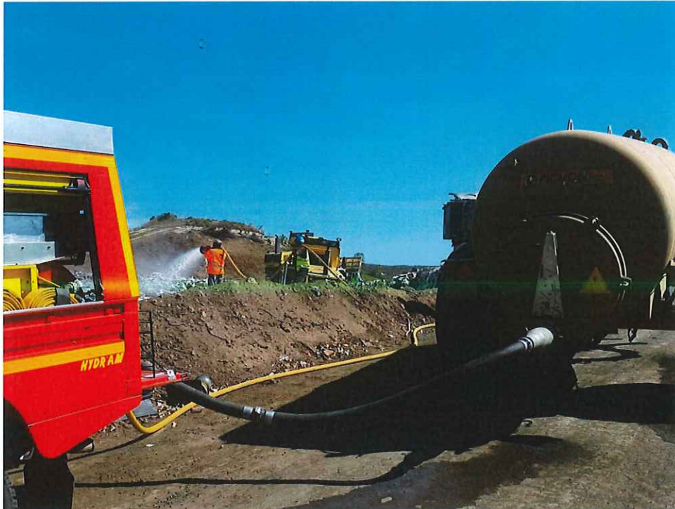
Photos 3 et 4 - Mise en place de la terre en couverture