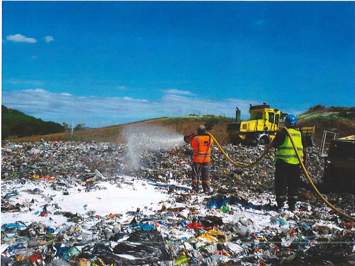
Photo 1- Extinction par lance mousse