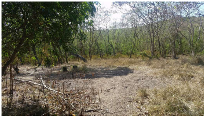
Faré1 : S22° 18.457' ; E166° 28.666'