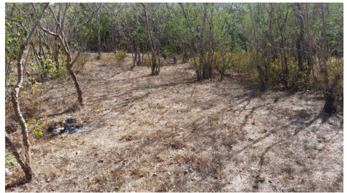
Faré 2 : S22° 18.502' ; E166° 28.682'