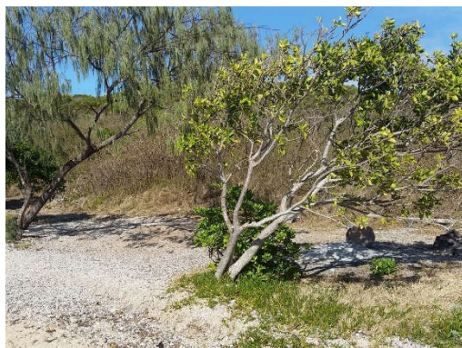
Combo 3 : S22° 18.747' ; E166° 28.427'