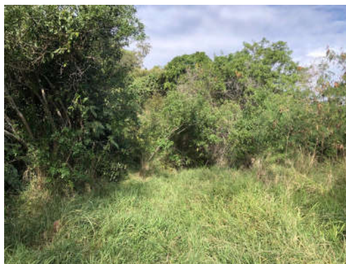
Combo 4 : S22° 18.588 ;' E166° 28.670'