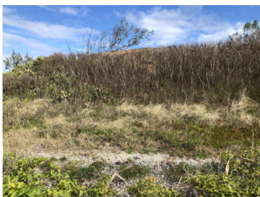
Combo 1 : S22°18.903' ; E166° 28.534'

Ces aménagements seraient implantés aux emplacements et coordonnées (WGS84) ci-dessous :