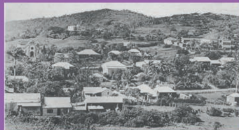
La Vallée des Colons vers 1902.