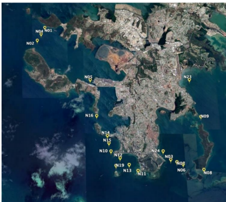
Carte des différents hydrophones permettant de détecter le passage des requins bagués

L'objectif de ces mesures est d'éviter d'aboutir à une situation comparable, où les attaques répétées de requins ont durablement impacté la pratique des sports nautiques et l'accès aux plages de l'île.