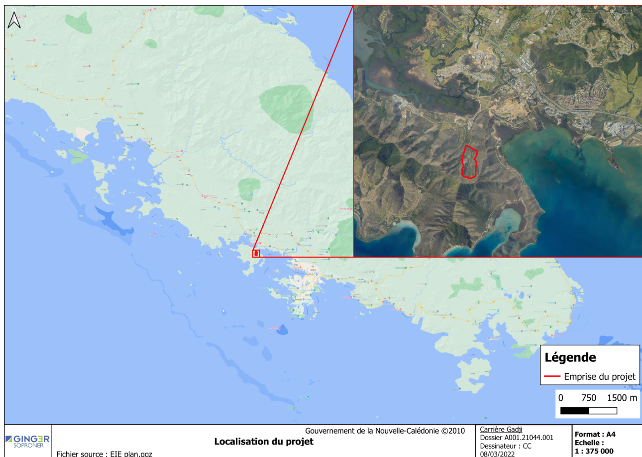
Figure 1 : Localisation du projet

Le projet est situé sur la presqu'île formée par la baie de Gadji et le Port Laguerre au niveau des monts Maa. Il se place dans la commune de Païta en province Sud (Figure 1).