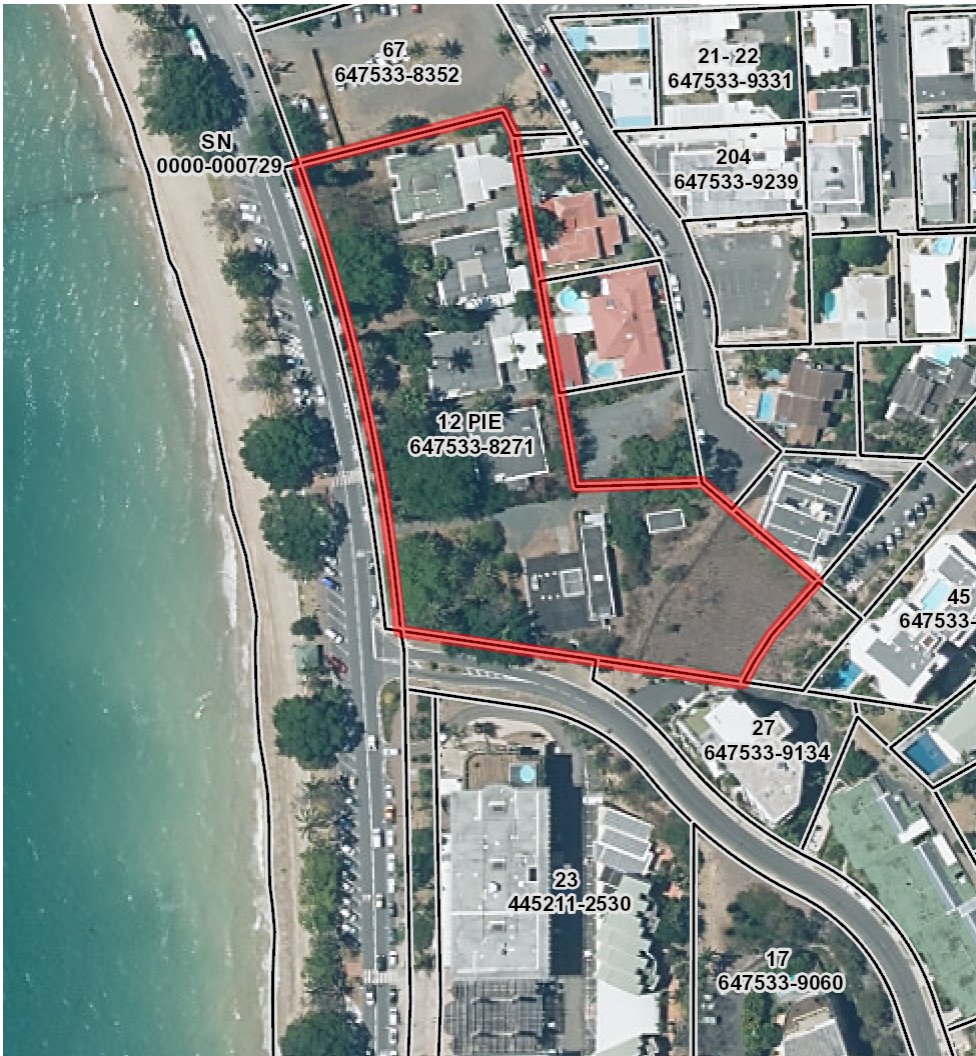
Extrait Cadastre échelle 1/2000