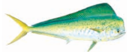
MAHI-MAHI Coryphaena hippurus