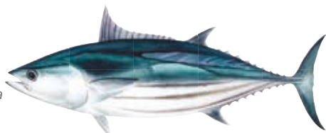
BONITE Katsuwonus pelamis