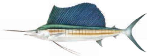
ESPADON VOILIER Istiophorus platypterus