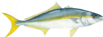
SÉRIOLE Seriola lalandi