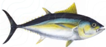
THON JAUNE Thunnus obesus

La capture des poissons pélagiques est limitée à 15 individus par bateau et par sortie : wahoo, mahi-mahi, bonite, coureur arc en ciel, sérieole, thon, voilier, marlin et espadon.