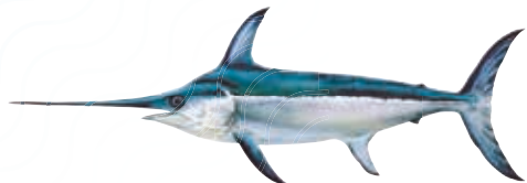
ESPADON Xiphias gladius