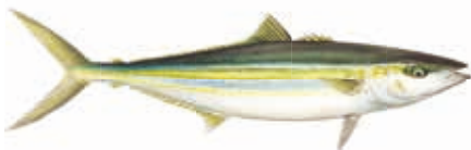
COUREUR ARC-EN-CIEL Elagatis bipinnulata