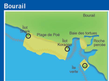
Aire marine protégée de Bourail