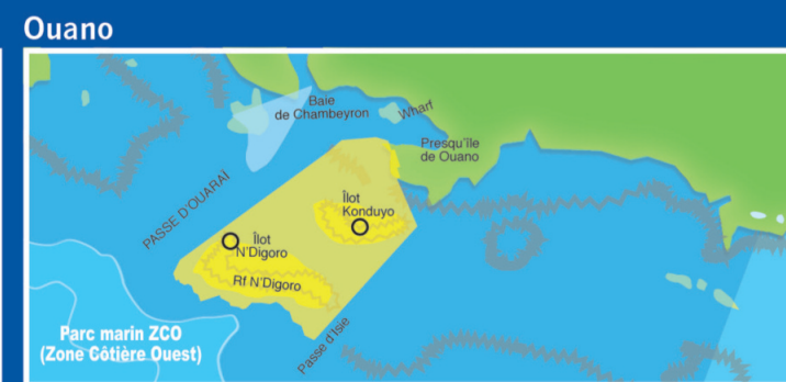
Aires marines protégées de Ouano

ATTENTION ! NOS COORDONNÉES DES AIRES MARINES PROTÉGÉES ONT CHANGÉ. CONSULTEZ-LES SUR province-sud.nc