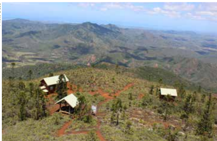
Refuge du Mont Do