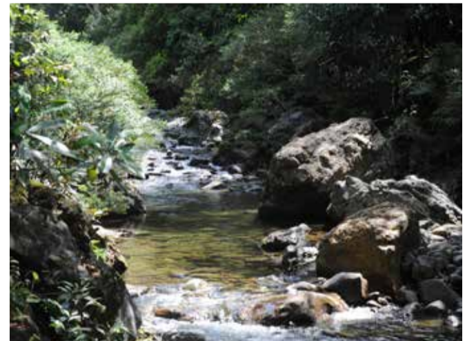
La rivière Oua Nonda