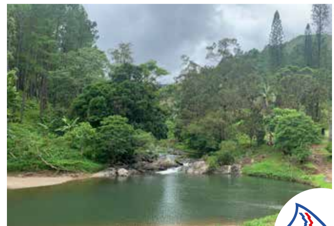
Rivière Oua Nonda