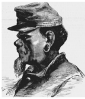
Gravure parue en première page du journal Le Voleur n°1109 du 4 octobre 1878. Portrait du chef kanak Atai.

La plus grande révolte mélanésienne concernait tout le centre-ouest de Bourail à Boulouparis. De nombreux événements liés à cette révolte se sont déroulés dans la région où évolue le sentier. Les prémices restent encore mal connues. Mais à cette époque, autour de Fonwhary, la colonisation pénale et les grands éleveurs étendaient de plus en plus leur emprise foncière. Les Mélanésiens perdaient leurs terres. Cette pression s'est concrétisée par les opérations de cantonnement de 1877.