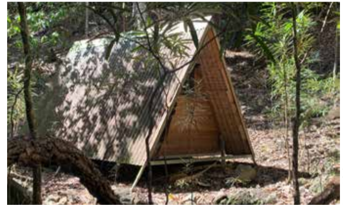
Abri de sécurité à proximité du point 4

6 Grand Banian (601 200 - 7 596 990 ; alt. 215 m) : [plusieurs creeks se perdent dans une cuvette (alt. 215 m). Un grand banian se trouve en bordure]. La pente se redresse. Le sentier s'engage dans une première série de lacets. Il va contourner un épaulement (alt. 302 m) puis chemine en suivant la courbe de niveau des 300 m avant de grimper de nouveau en lacets dans la pente qui devient de plus en plus raide. Il franchit la crête à l'Est du col des Sapins dans une petite selle (alt. 501 m).