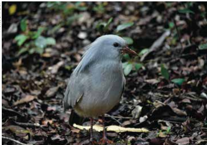
Cagou (Rhynchotos jubatus) à proximité du point 3