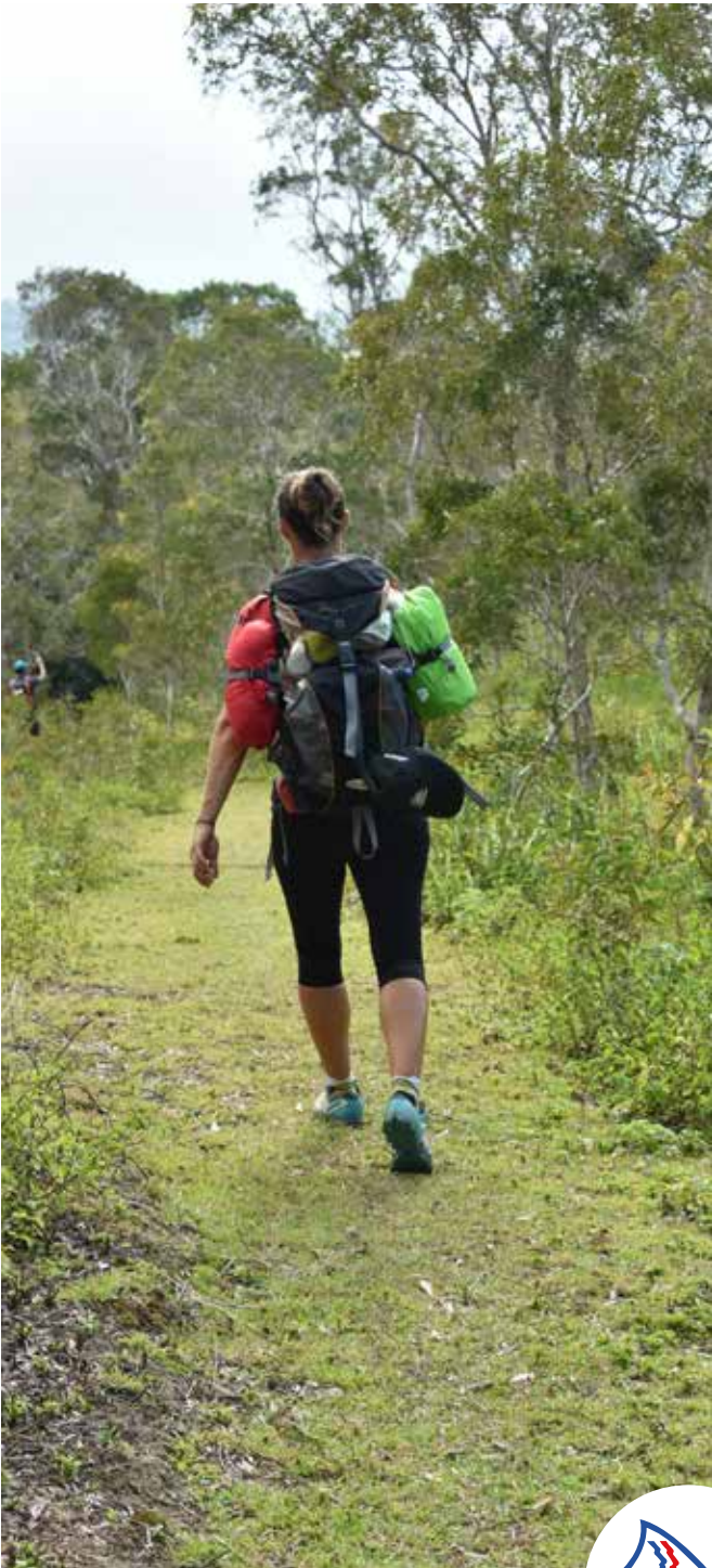
À l'approche de la tribu de Ouipoin