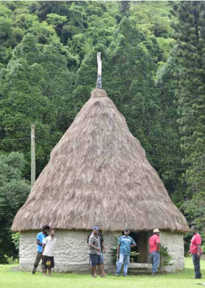
Grande Case de la tribu de Ouipoin

Tribu Ouipoin (600 573 – 7 605 688 ; alt. 157 m) : le chemin débouche à proximité du terrain de sport, non loin du gîte « Chez Élise » (600 667 – 7 605 681 ; alt. 167 m) ; [Élise peut organiser des transports depuis chez elle jusqu'au départ du sentier à Nassirah. Tél : +687 35 45 22 - GSM : +687 95 57 44].