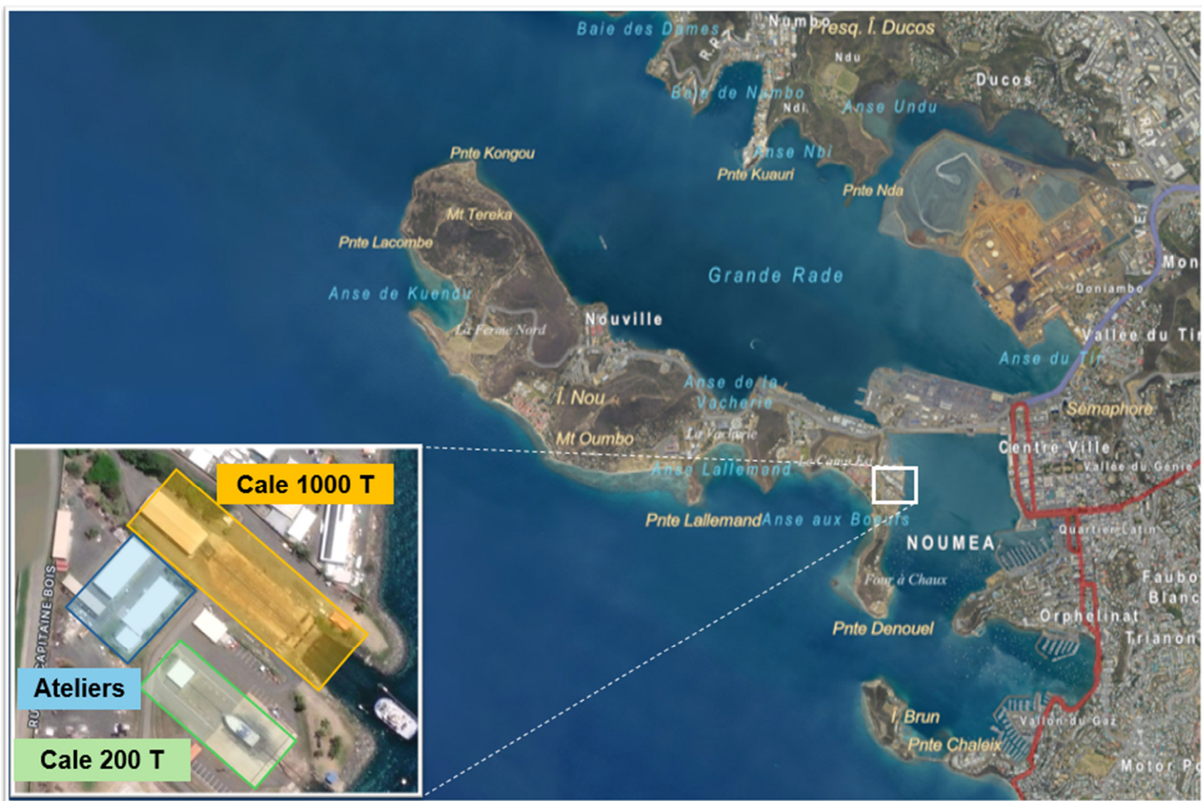
Figure 4 : Localisation des installations