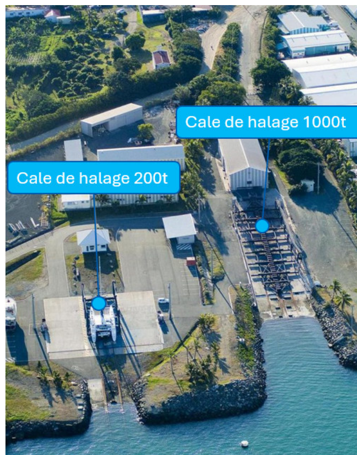
Figure 2 : Localisation des cales de halage 200T et 1000T (adapté du PANC)

Le projet consiste en l'ajout d'une activité supplémentaire de déconstruction navale. Ces activités de démantèlement de navires nécessitent la réalisation d'un dossier de demande d'autorisation d'exploiter. Cette activité est soumise à la rubrique 2712 suivant le code de l'environnement de la Province Sud.