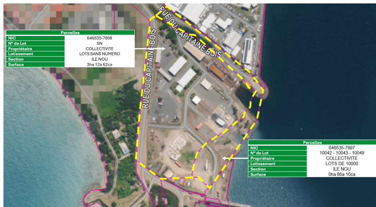
Figure 5 : Parcelles cadastrales dans la zone

La figure ci-dessous présente les différentes parcelles cadastrales présentes au droit et autour du projet.