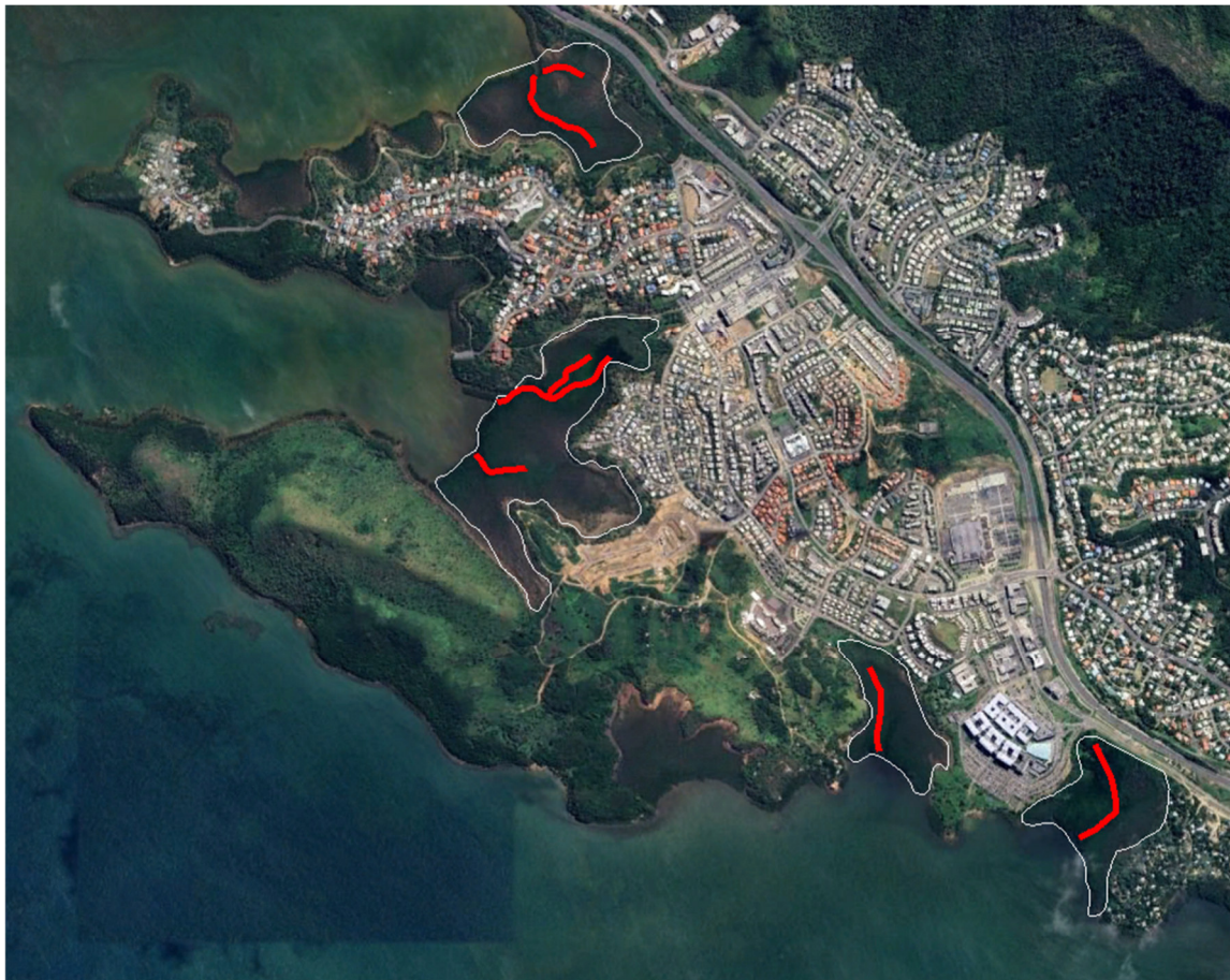
Figure 1 : Localisation des chenaux à entretenir

Les chenaux qui seront entretenus correspondent à la zone à Rhizophora (pas d'intervention dans la zone à Avicennia) ; ils sont visibles sur la photo aérienne de 1976 et toujours visibles sur les images satellites récentes ; environ 1800 mètres linéaires de chenaux sont identifiés pour bénéficier de ce chantier.