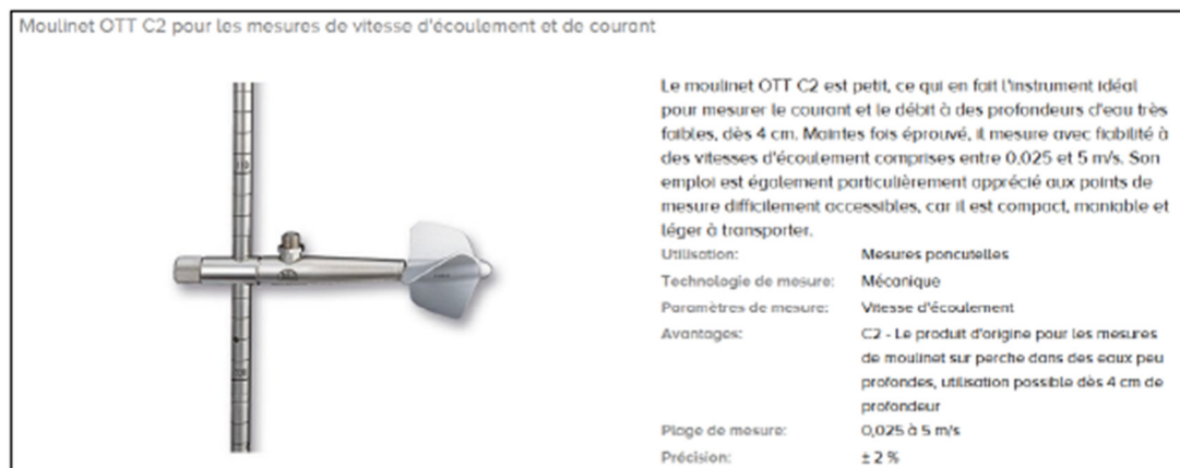
Figure 2 : Moulinet modèle OTT C2 pour les mesures de vitesse d'écoulement

Un jaugeage au moulinet (modèle OTT C2) sera réalisé pour caractériser les vitesses d'écoulement (Figure 2). Les jaugeages seront réalisés au moulinet suivant la méthodologie en vigueur avec la sélection d'un site propice au jaugeage en fonction des conditions d'écoulement et de sécurité des opérateurs, le jour du jaugeage. Le site sera choisi au droit d'écoulements les plus laminaires possibles. La section de jaugeage sera orthogonale au ligne de courant pressenties.